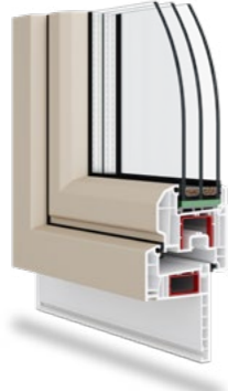
Smartline+ Elegance półlicowane