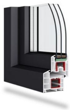
Smartline+ Classic niezlicowane